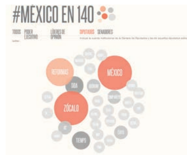
Imagen 2. Palabras utilizadas con mayor frecuencia en Twitter (diputados).