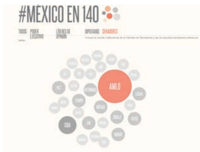
Imagen 1. Palabras utilizadas con mayor frecuencia en Twitter (senadores).