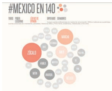
Imagen 3. Palabras utilizadas con mayor frecuencia en Twitter (líderes de opinión).